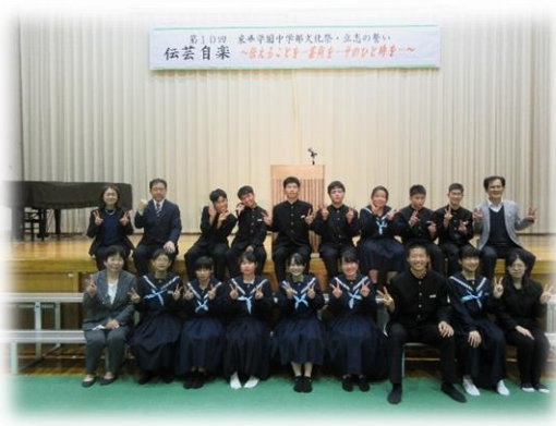
9年生「立志の誓い」後の記念撮影