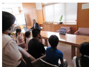
校長室から発信しました

校長室と各学級をリモートでつなぎ、遠隔による2学期始業式を行いました。新型コロナウイルス感染予防対策の一つとして、初めての試みでした。2学期のめあてを発表する9名の子どもたちも大きな声で発表することができました。