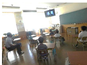
リモート始業式の様子