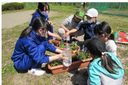
子どもは失敗の中からたくさんの事を学びます

私たち大人の役割は、子どもが失敗を乗り越えられる最小限の支援と、「できた」、「最後までやれた」などの成功体験を経験させることではないかと考えています。