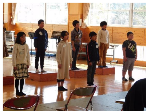
健やかな成長を願っています

未来の自分を見つめ、今できることを真剣にそして誠実に取組もうとする4年生の姿に感動しました。2月19日(金)、たくさんの保護者の参加を賜り、4年生の「10才を祝おう会」を盛大にそして厳粛な中に実施することができました。この会の名前のとおり、10才となった子どもたちは、20才で迎える成人式までの道のりの半分に至りました。一つ一つの言葉を大切に宣言する「私たちの未来」は、私たち大人の心を震わせ、すばらしい感動を与えてくれました。これからもたくさんの思いに包まれて成長していく4年生。賢く・優しく・たくましく成長してほしいと願っています。