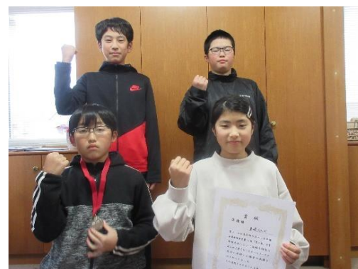
6年生みんなで、ガッツポーズ!!