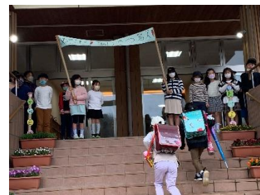
小学部の挨拶運動の様子