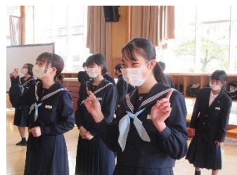
ゲームで盛り上げる先輩