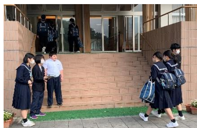
朝7時30分 中学部の挨拶運動

東峰学園では、立ち止まって、立ち上がって、目を見て、会釈をして、笑顔で、元気な声で「おはようございます」「こんにちは」と挨拶できる子どもを目指しています。挨拶の音が学校中に響く文化を創っていきます。